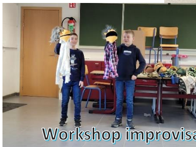
Workshop improvisatie poppenspel